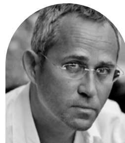
Jérôme Cornuau Réalisateur